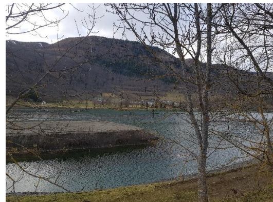
Le lac remis en eau le 29 janvier