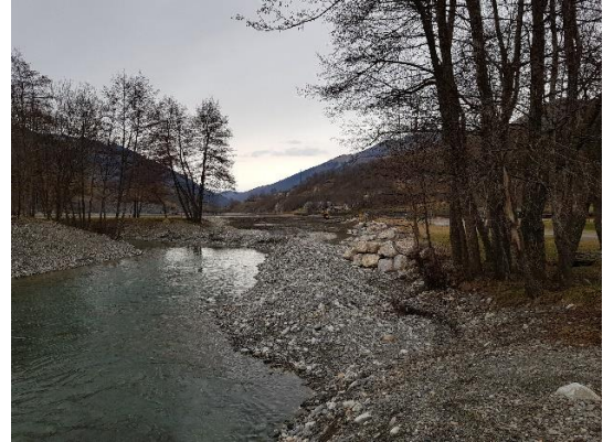
arrivée d'eau dans le lac déviée