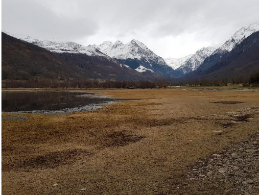
Le lac abaissé début janvier